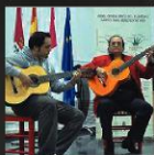
“Un pellizco de Flamenco”